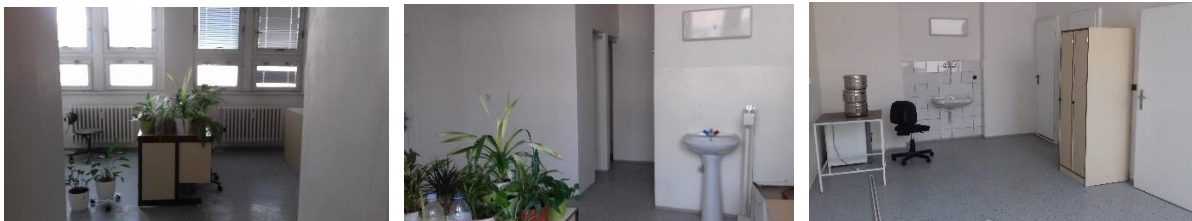
m.č. 246, 247, 248, 240