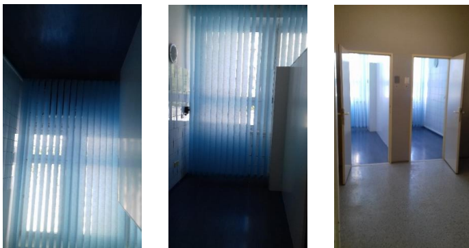
m.č. 2.19, 2.81 + podiel 2.15