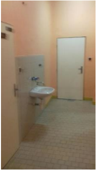
m.č. 239,240 servisný priestor