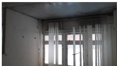
m. č. 179, 180