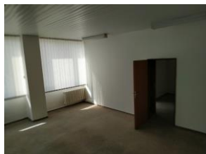
91a trakt F.