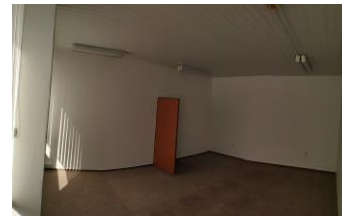
91a trakt F.