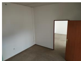
91a trakt F.