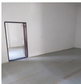
m. č. 118+119

obhliadky: Zuzana SPIŠÁKOVÁ tel. č. 915 697585, Marcela Vysopalová tel.č. 0905 868 164