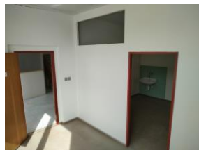
91a trakt F.