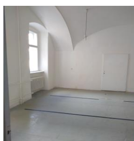
m. č. 222+223+224