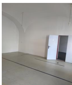
m. č. 118+119 (2)