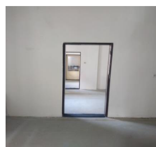
m. č. 222+223+224