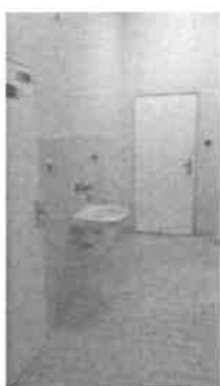
m.č. 239,240 servisný priestor