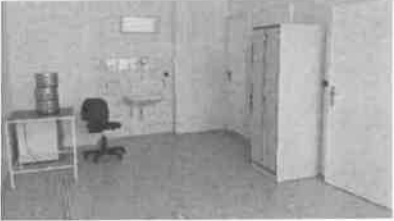
m.č. 246, 247, 248, 240